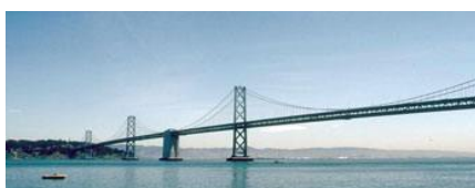
Wij slaan een brug tussen het heden en de toekomst

Er vinden wekelijkse sessies plaats. Door omstandigheden kan de doorlooptijd langer zijn. Dit kan komen door vakantie en/of ziekte. Ook kan een carrièreswitch de reden zijn dat de doorlooptijd langer wordt.